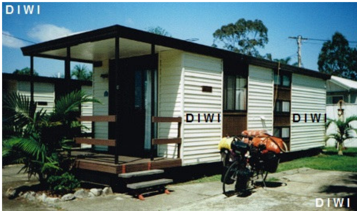
Standard Cabin

Beispiel Einrichtung einer Standard Cabin: Bett, Stuhl, Tisch, Licht. Ein Schlafsack ist mitzubringen (Bettwäsche kann alternativ gemietet werden).