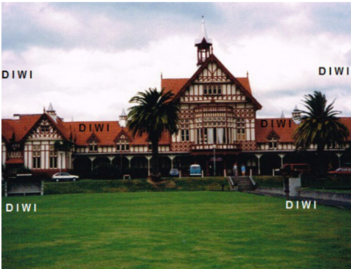
Rotorua old Bath