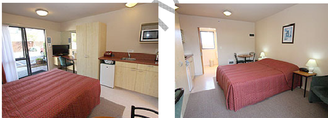
2 Picture by Bella Vista: Standard Unit + Family Unit

Ein Motel Unit (self-contained) ist eine unabhängige Übernachtungseinheit, die eine Selbstversorgung ermöglicht. Zur Standard-Ausrüstung gehören: Bad, Heizlüfter, TV, Radio, Telefon, Tee- / Kaffee Kocher, Kühlbox - Mikrowelle oder auch Ofen.