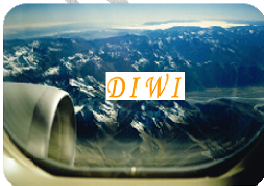
Flug über die Südalpen

New Zealand Map & Kiwi © Tourism New Zealand Reiseroute © Dieter Wiedelmann