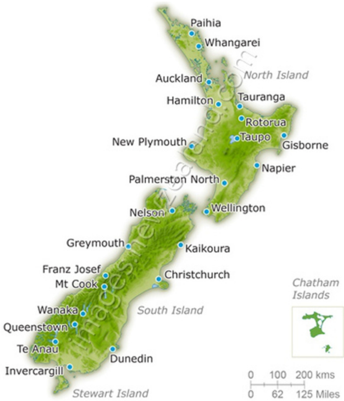
New Zealand Map & Kiwi