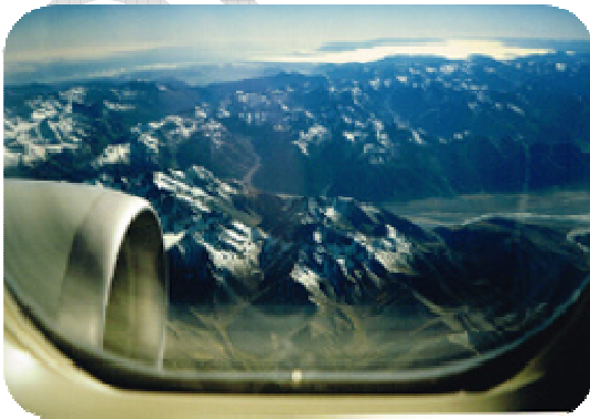
Flug über die Südalpen