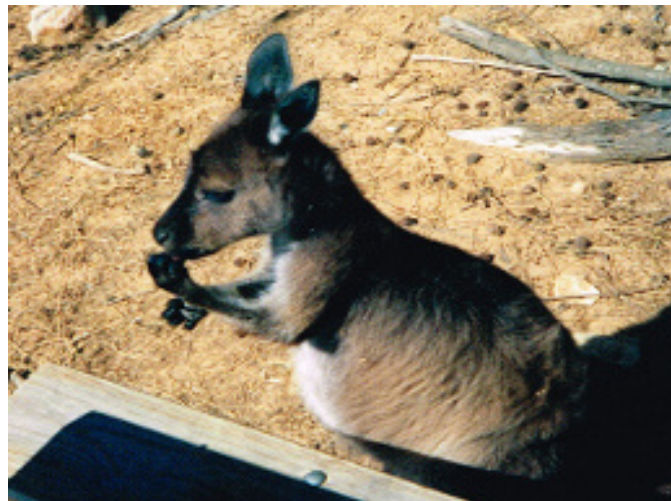
Koala & Känguru