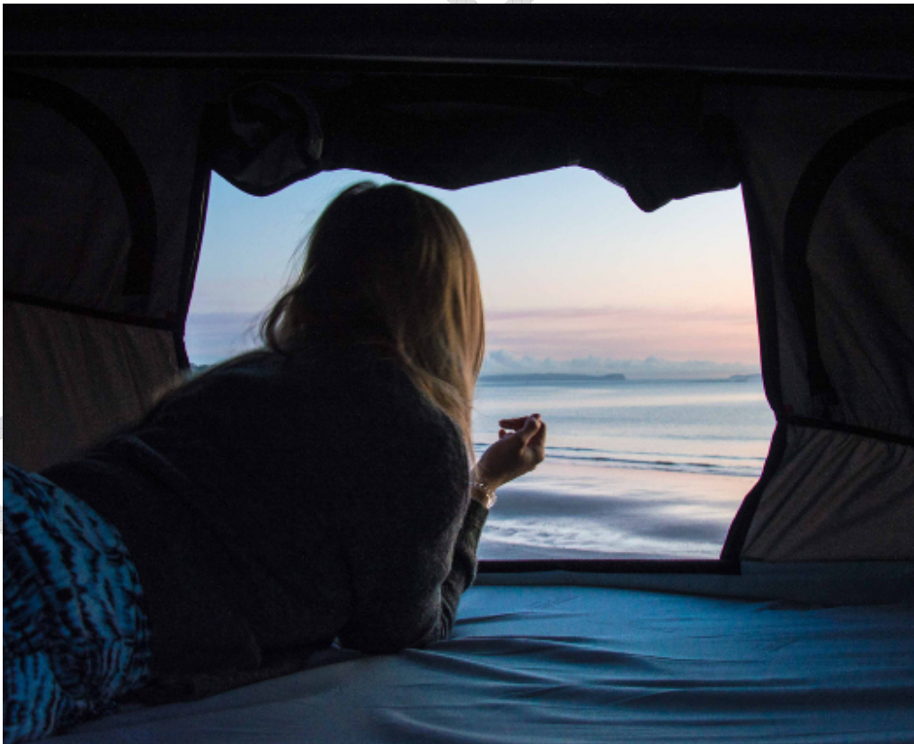
Camping - © Jucy

Aufgrund des Klimas gibt es in Australien zahlreiche Campingplätze, gut gepflegt und immer mal an ganz besonderen Plätzen gelegen. Sanitäre Anlagen mit Dusche, Toilette, WC sowie Waschmaschinen und Trockner sind selbstverständlich. Meistens sind eine Camp Küche mit Barbecue, Pool und weitere Freizeiteinrichtungen vorhanden.